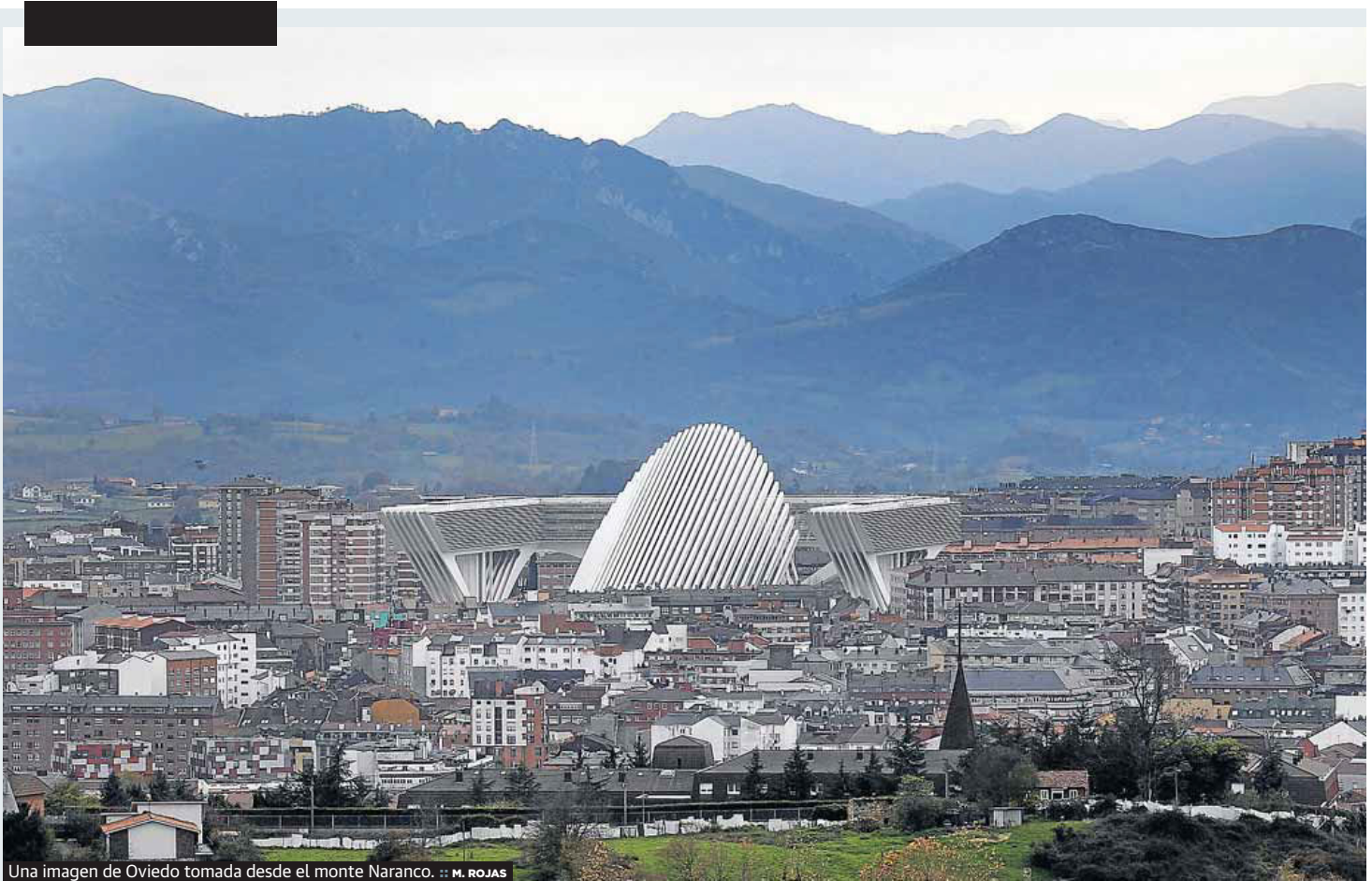
Una imagen de Oviedo tomada desde el monte Naranco.