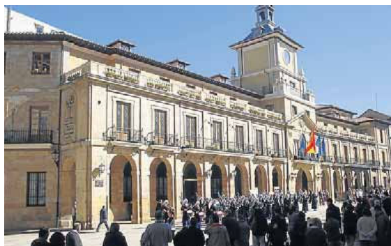
El Ayuntamiento centra muchas de las preocupaciones. :: M. R.

Cuesta asegura que no le gustaría que el próximo Ministro de Justicia que ocupe el cargo, hiciese oídos sordos a las reivindicaciones del colectivo que representa. «La persona que se haga con la nueva cartera de Justicia debe de contar de manera significativa con la abogacía, sobre todo en lo que afecta al colectivo». El responsable del Decanato del Colegio de Abogados de Oviedo pone dos ejemplos. «Se debe agilizar, ya, la puesta en marcha de la ley de Colegios Profesionales». Esta normativa fue retirada de la agenda política, en mayo de 2015,